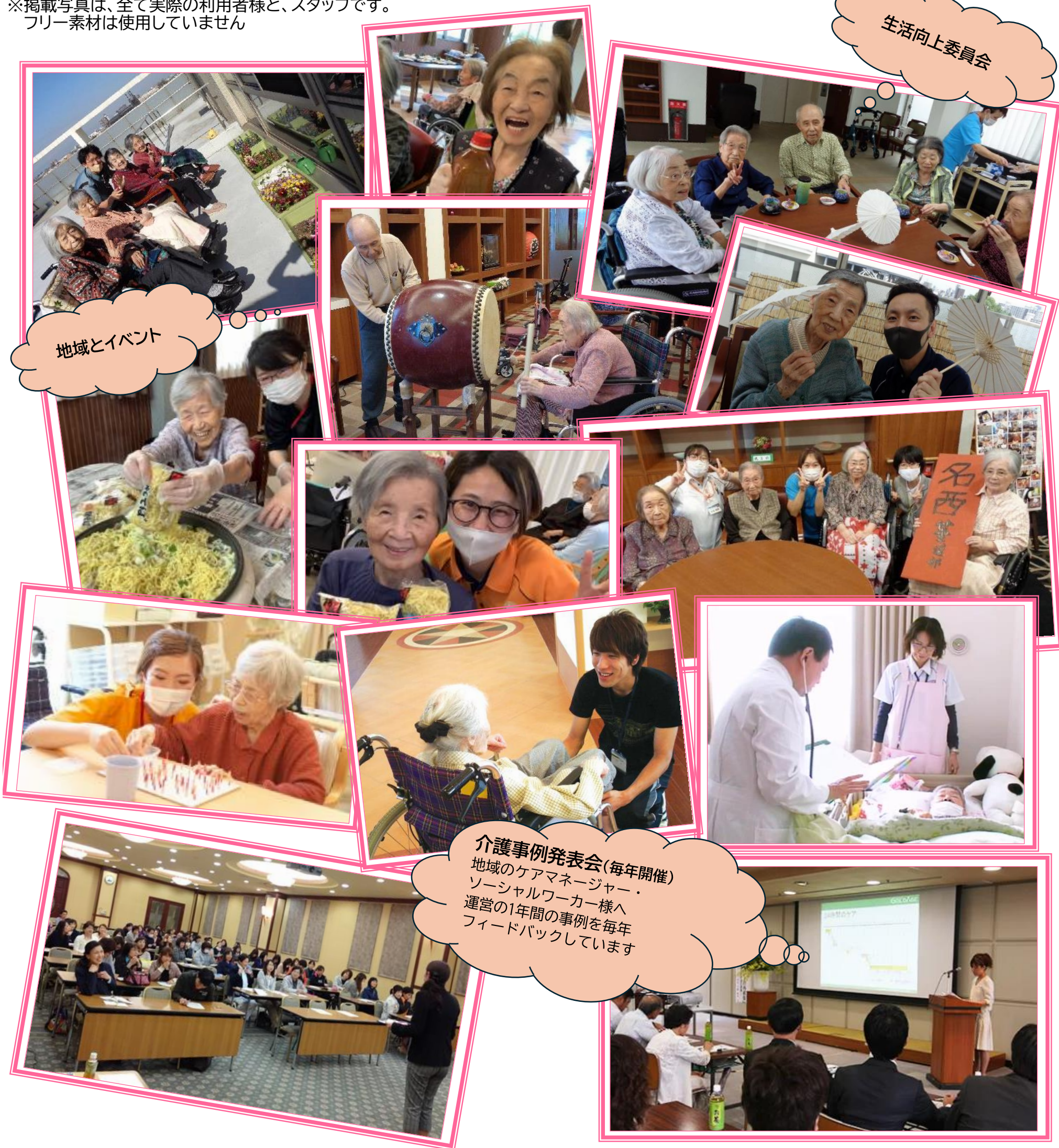
介護事例発表会(毎年開催) 地域のケアマネジャー・ ソーシャルワーカー様へ 運営の1年間の事例を毎年 フィードバックしています